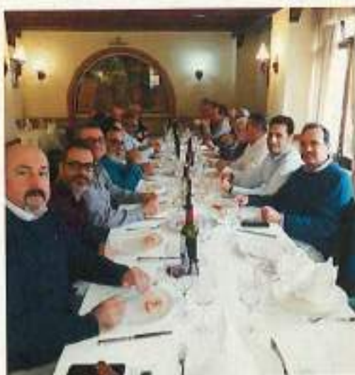
Un momento durante la comida de Navidad

Después de la Asamblea se celebró la tradicional comida de Navidad de la Asociación.