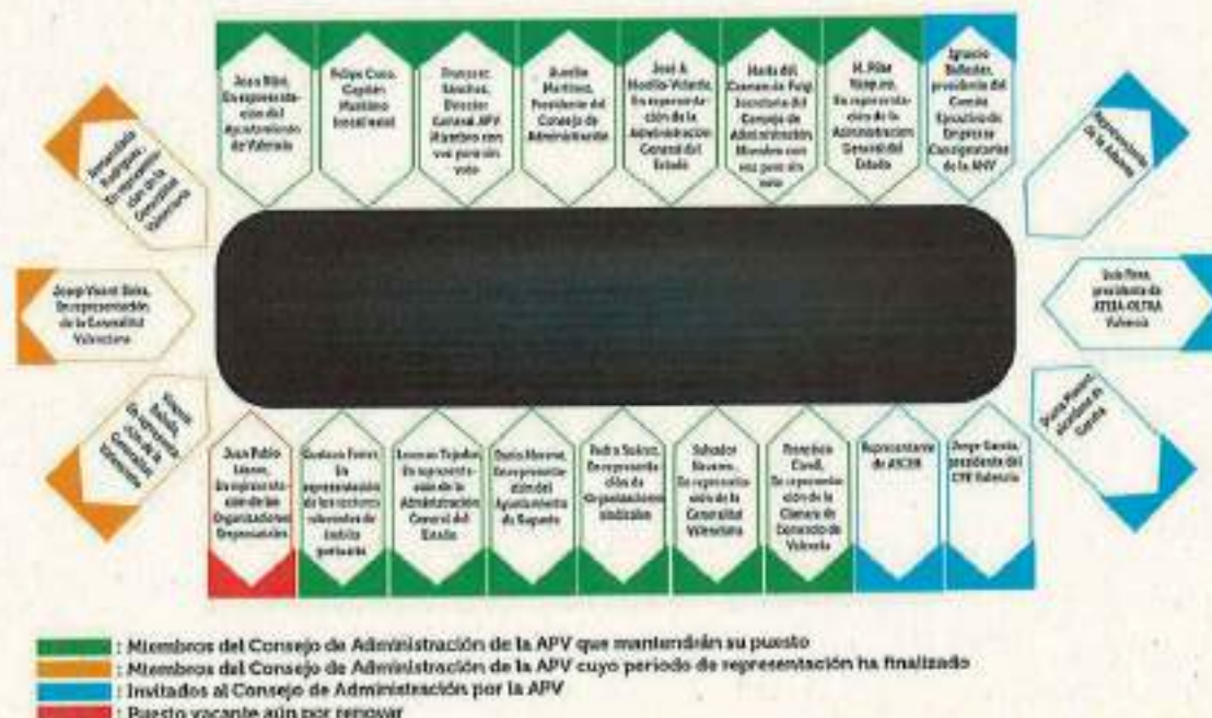
COMPOSICIÓN ACTUAL DEL CONSEJO DE ADMINISTRACIÓN DE LA AUTORIDAD PORTUARIA DE VALENCIA

La salida de representantes empresariales del Consejo de Administración se produce con el proyecto de la nueva Ley de Puertos de la zona.