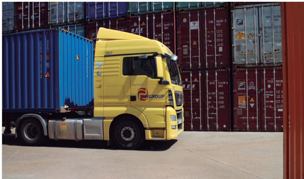
El sector aduanero es sólo uno de los muchos ámbitos afectados por este Proyecto de Ley.

Por un lado, el Grupo Parlamentario Socialista, principal partido que sustenta al actual Gobierno, ha desoído en sus enmiendas la práctica totalidad de las demandas sectoriales.