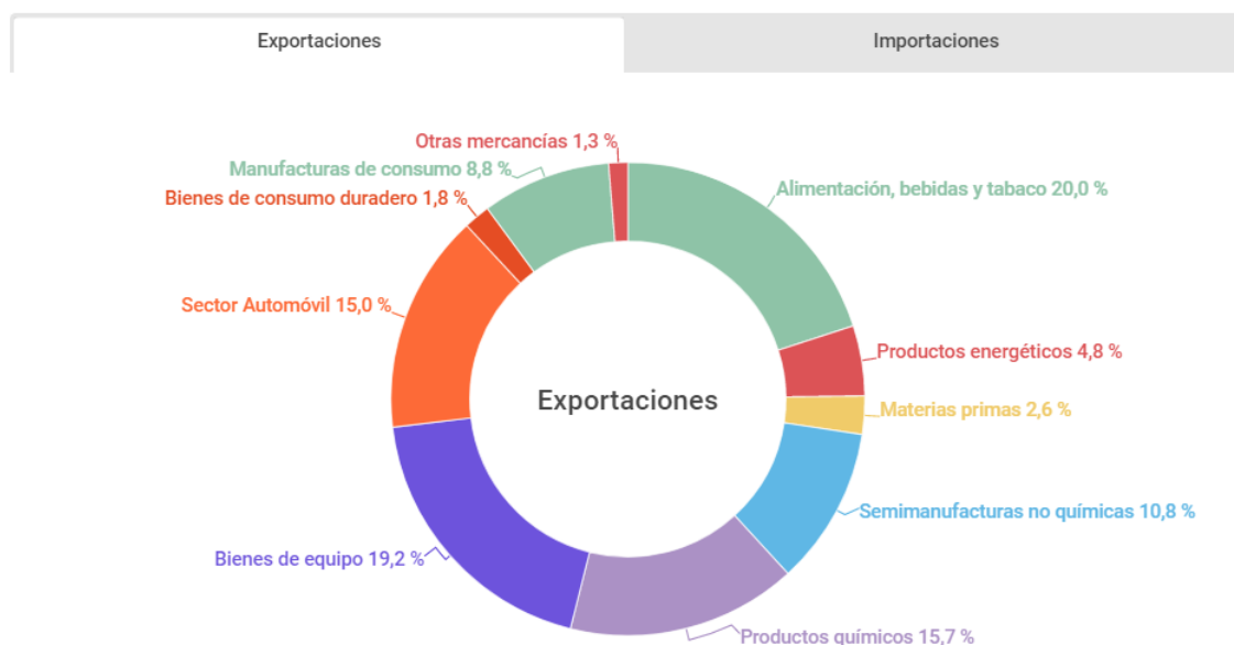
PORCENTAJE SOBRE EL TOTAL DE EXPORTACIONES E IMPORTACIONES ESPAÑOLAS POR SECTORES (Ene-Feb 2021)